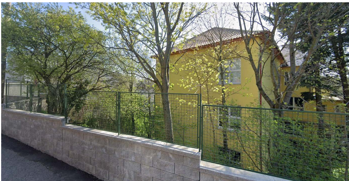
koncertná sála – Gorazdova 20