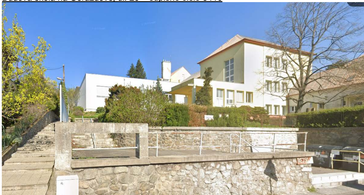
Budova škola na Gorazdovej ul. 20 – súpisné číslo 3416